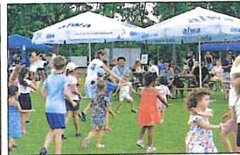
Gemeinsamer Sport beim Sommerfest