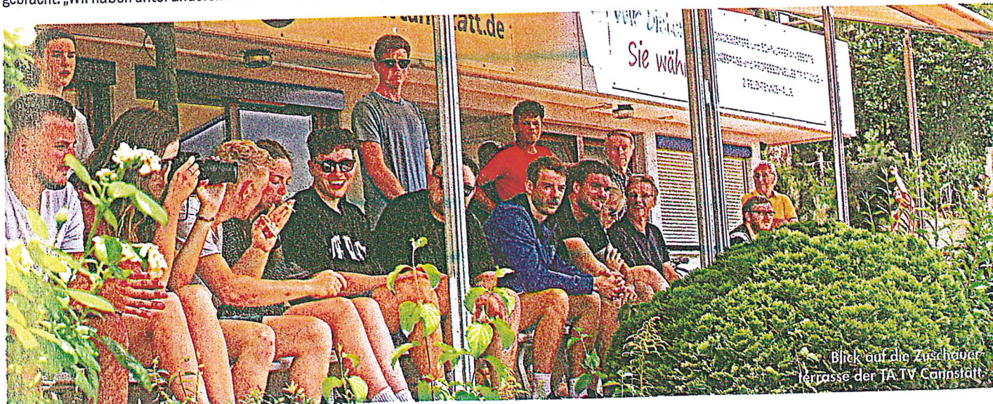
Blick auf die Zuschauerterrasse der JA TV Cannstatt